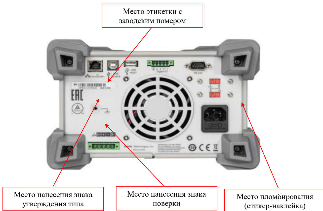
Рисунок 2 - Задняя панель источников модификаций DP811/DP811A, DP813/DP813A