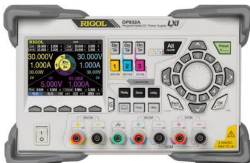
Рисунок 4 - Передняя панель источников модификаций DP831/DP831A, DP832/DP832A